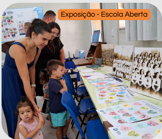
Exposição - Escola Aberta

114 anos de histórias que continuam acontecendo